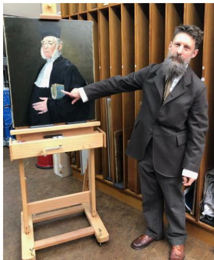
Adnewyddu portread Manet

friends cyfeillion national amgueddfa museum cymru wales