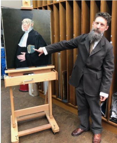
Adfer y Manet