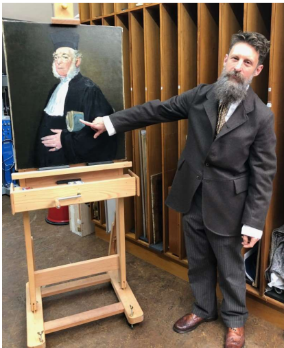
Adnewyddu portread Manet

friends cyfeillion national amgueddfa museum cymru wales